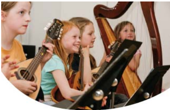
Die Musik machen wir!

Aber natürlich können auch ältere Kinder, Jugendliche und auch Erwachsene jederzeit das Spielen der Gitarre erlernen. Als Unterrichtsformen werden sowohl Gruppenunterricht als auch Einzelunterricht angeboten. Die Gruppenformation hat sich vor allem im Anfängerbereich bewährt.